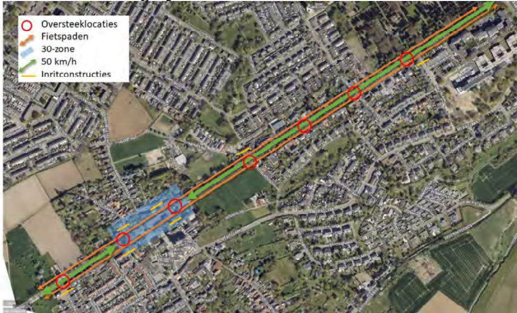
Kaartje bij Project Tongerseweg met voorgestelde maatregelen; reconstructie tussen grensovergang en Javastraat