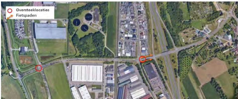
Kaartje bij Project Köbbesweg met voorgestelde maatregelen